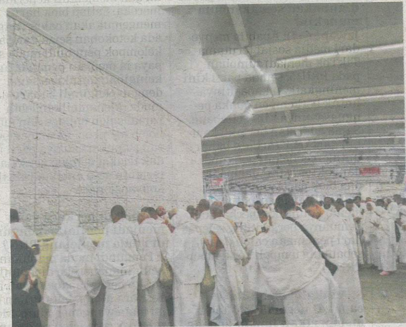
Jemaah haji melaksanakan ibadah melontar di Jamarat.