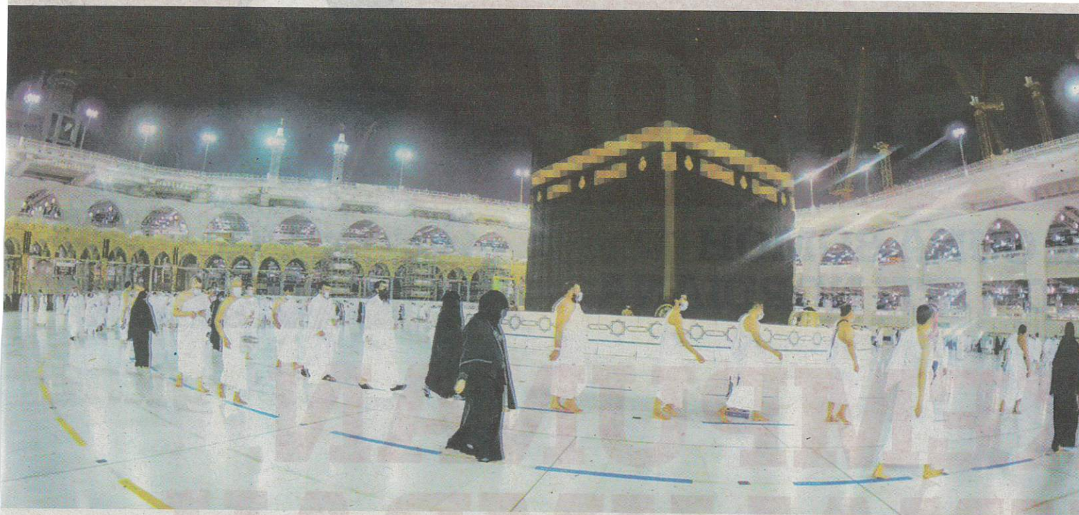
KESEMUA mangsa mendakwa mereka sepatutnya menunaikan umrah pada 15 Mei 2023 sebelum ditunda ke 8 November 2023. – GAMBAR HIASAN